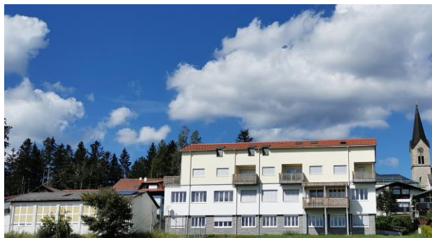
Ideale Umgebung, Übungsplätze, Seminarräume und Lebenswasser mit vollem Qi nach der FengShui-Lehre

Heilungsmodell der TCM nach den Fünf Elementen/Wandlungsphasen. Integrierende Regulierung von Geist, Körper und Atmung